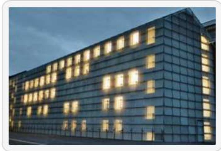
Hofspange der Jahrhunderthalle in Bochum mit feuerverzinkter Streckmetallfassade

Hofspange an der Jahrhunderthalle Bochum